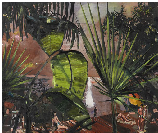
Marius Bercea, Body Toner Satire , 2015, ulei pe panza, 160 x 190 cm.

Piscine amplasate in mijlocul unei sere coplesite de vegetatie luxurianta sau al unei gradini acoperite de un luminator modernist, personaje care par sa inainteze printre decorurile unei productii cinematografice sau sa fie ultimii supravietuitori ai unor dezastre, ritualuri intr-un decor straniu, deopotriva magic si amenintator – cu lucrarile sale recente, Marius Bercea adauga noi dimensiuni „Transylforniei“, colajul vizual si simbolic ce-l preocupa de cativa ani.