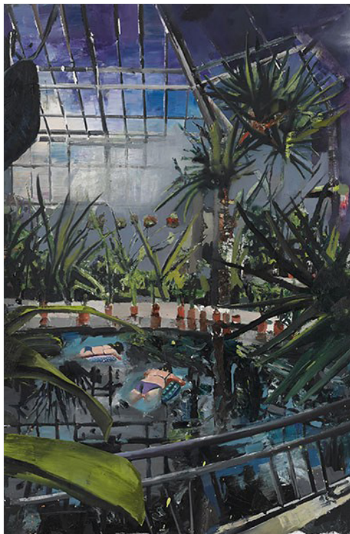
Marius Bercea, The Botanists , 2015, ulei pe panza, 85 x 130 cm.

Piscine amplasate in mijlocul unei sere coplesite de vegetatie luxurianta sau al unei gradini acoperite de un luminator modernist, personaje care par sa inainteze printre decorurile unei productii cinematografice sau sa fie ultimii supravietuitori ai unor dezastre, ritualuri intr-un decor straniu, deopotriva magic si amenintator – cu lucrarile sale recente, Marius Bercea adauga noi dimensiuni „Transylforniei“, colajul vizual si simbolic ce-l preocupa de cativa ani.