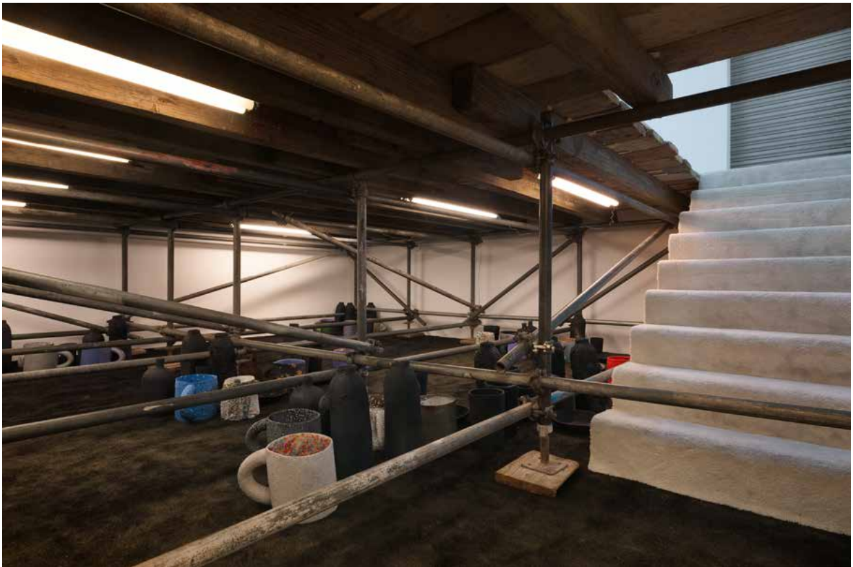
"The Third Floor" installation view at François Ghebaly Gallery, Los Angeles, 2013.