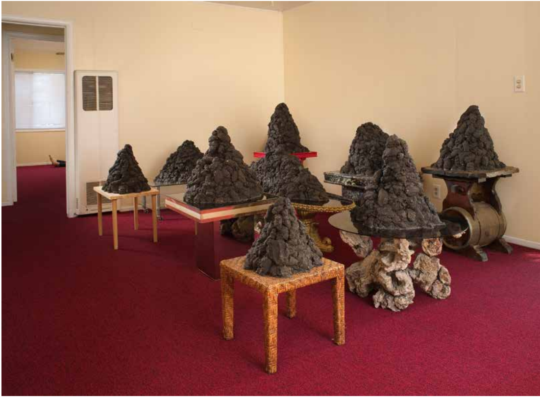
Dirt Piles on Tables , 2011, "House of Double" installation view at François Ghebaly Gallery, 2011. Courtesy: the artist and François Ghebaly, Los Angeles

At the opening people sip cold beer and wander in and out of the apartment, making idle chatter amidst this strange tableau, cycling in and out, unable to unriddle the scene. I try to imagine that this isn't an art show, but a door I stumbled upon, open. What circumstance might make such a series of objects possible? A murder maybe? What is murder but an action that metamorphoses a person into a thing? Dead bodies are merely things anyway, once they've been emptied of life, of the spirit that makes a person. Skulls sometimes are just tchotchkes on morbid collectors desks, skeletons dangling in biology classrooms are teaching tools, no longer persons. Finger the flesh and you know it's just latex, but that does not make it any more explicable.