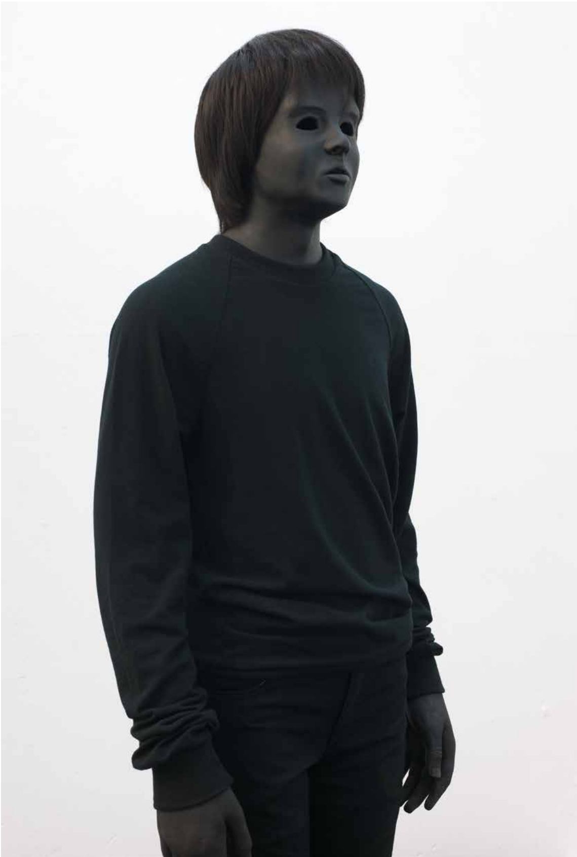
Black Statue , 2013, "The Third Floor" installation view at François Ghebaly Gallery, Los Angeles, 2013.