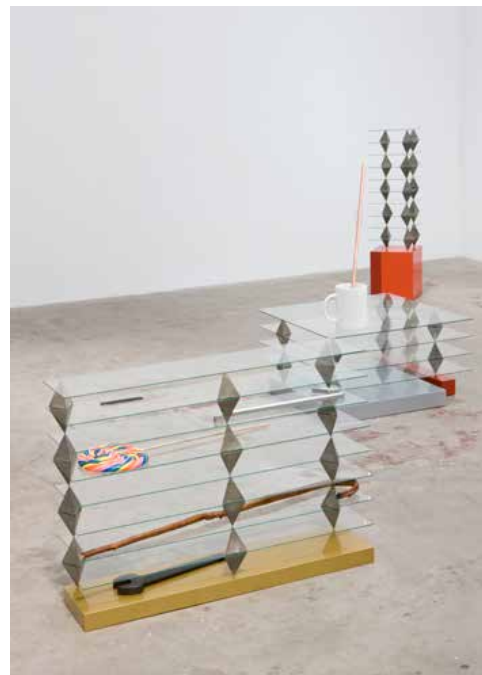
"City Unborn", François Ghebaly Gallery (formerly Chung King Project), Los Angeles, 2008.

Accompanying their inaugural display however, Jackson made a poster that quietly revealed and redeemed. Above the announcement of the artist, the gallery, the fair, two cartoon characters from the Simpsons stand side by side: the thick, ponytailed comic-book dealer and the insidious oligarch Mr. Burns. Each has a long, well-written speech talk-bubbled above. The comics dealer states that these tchotchke stacks make "an exceptional prop for a contemporary Dario Argento film, used to first foreshadow, and ultimately to execute, the untimely and gruesome death of a beautiful young thrift store clerk." Mr. Burns replies, "Cats, dogs, various forms of hugs and other signs of love—the perfect decorations for some drone's cubicle. Dust collecting representations of hopes and dreams won't fill in for anything their hollow lives lack. However, the one tchotchke titled 'bundle of joy' is rather endearing."